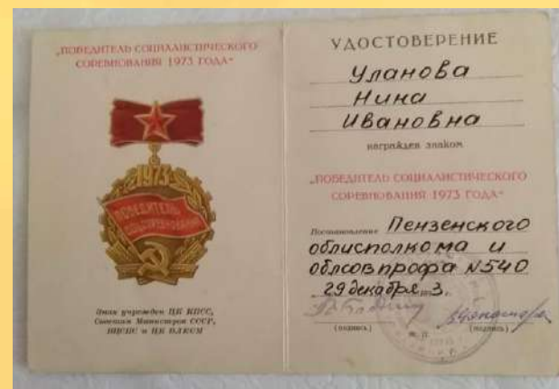
Удостоверение о награждении знаком «Победитель соревнования 1973года»

Эти награды мы бережём, чтобы и наши потомки знали о своих предках!