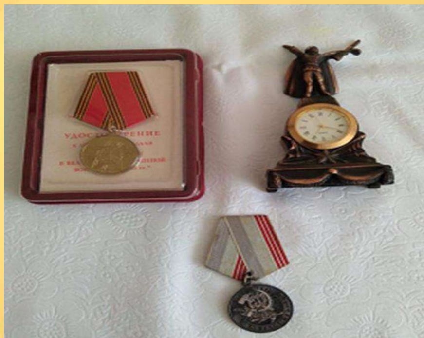
Медаль «Ветеран труда СССР»

В нашей семье хранятся, как реликвии, документы и фотографии моей бабули и мне хотелось бы Вам всем показать некоторые из них.